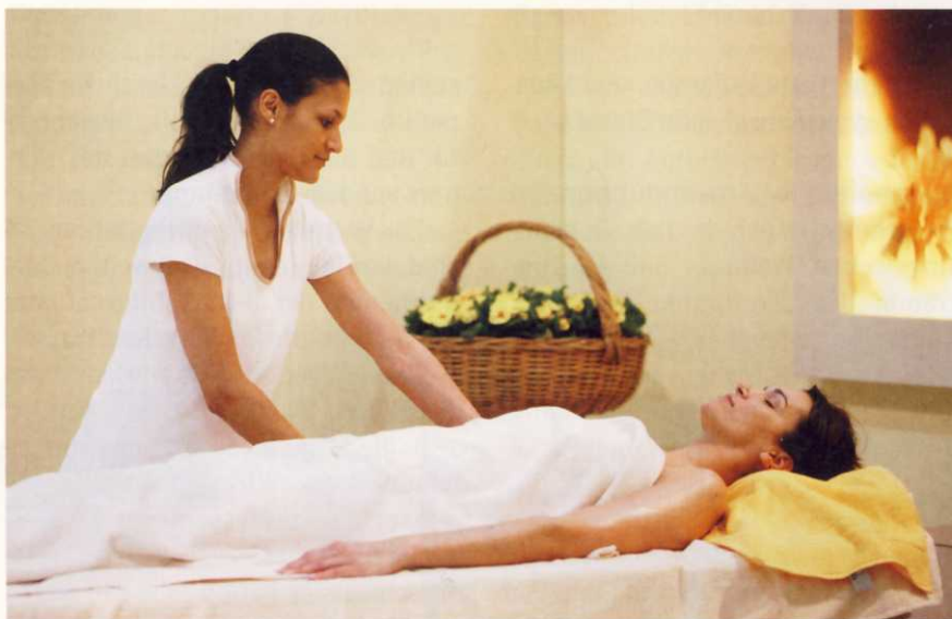
In Düsseldorf stehen v. a. Behandlungen im Fokus, die helfen, sich zu entspannen und Energie zu tanken

Ein besonderes Highlight ist die Verleihung der Auszeichnung „Spa-Manager des Jahres“ am Samstag, den 10. März 2012. Die Messegesellschaft und der Deutsche Wellness Verband möchten so das hohe Anforderungsprofil dieser im deutschsprachigen Raum noch relativ jungen Berufsgruppe würdigen. Die drei Top-Finalisten werden in einer Diskussionsrunde über ihre Erfahrungen im Spa-Management berichten. Außerdem verleiht der Deutsche Wellness Verband ebenfalls am Samstag den 2. Green Spa Award für den ökologisch, gesundheitlich und sozial nachhaltigen Betrieb eines Spas. □