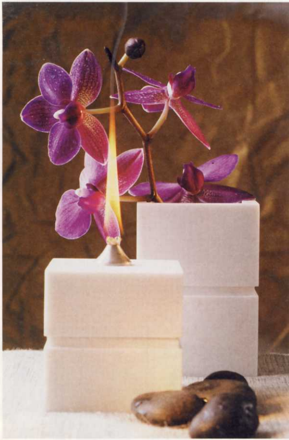
Einen Messeschwerpunkt bildet das Energetic Spa, bei dem Raumgestaltung und Anwendungen die Energieprozesse positiv beeinflussen sollen

der Psychologie und Wirkung von Düften. Und im Fish Spa sind Hunderte kleiner Fische namens Garra rufa im Einsatz und knabbern bei Maniküre und Pediküre abgestorbene Hautzellen ab. Diese spezielle Form der Haut-